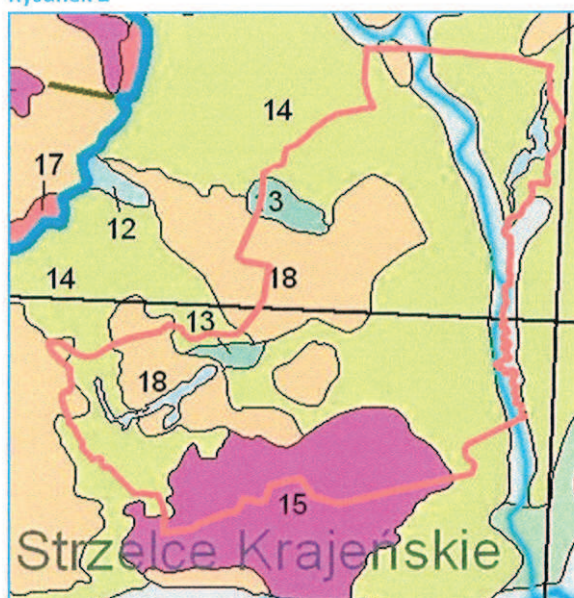
Wyrys z Mapy Geologicznej Polski skala: 1:500000